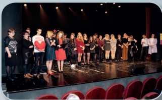
Gramy dla Bogusia