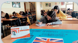
Konkurs języka angielskiego „Barbacki”