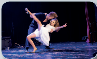
Guzik z pętłką